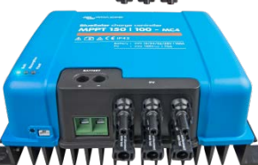
Controlador de carga solar MPPT 150/100-MC4