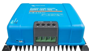
Controlador de carga solar MPPT 150/100-Tr