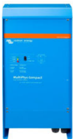
MultiPlus Compact 12/2000/80

Y hay disponible un sofisticado software (VE.Bus Quick Configure y VE.Bus System Configurator) para configurar varias nuevas y avanzadas características.